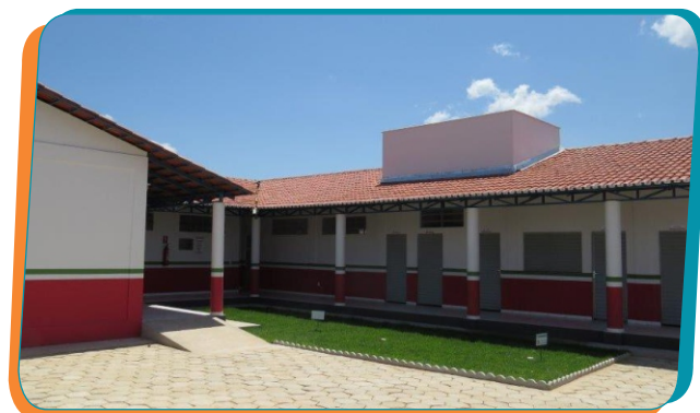
Inauguração da nova Escola Nelson Maranhão: conforto e segurança para alunos, professores e pais

Duas importantes obras foram inauguradas pelo CESTE nos últimos meses: a nova ponte sobre o rio Itaperucu, no Povoado Taboquinha, e a nova Escola Nelson Maranhão, ambas reconstruídas em substituição às antigas edificações. Da velha ponte de madeira, por exemplo, restou apenas a lembrança. Em seu lugar, os moradores do Povoado Taboquinha receberam uma nova ponte, de concreto e com equipamentos de segurança para oferecer conforto e bem-estar a quem trafega pelo local.