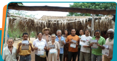
Pag. 02 - Famílias lindeiras recebem recursos de apoio à produção

Com a execução das obras, a nova escola, inaugurada no dia 2 de dezembro, passou a ter 413,45 metros quadrados de área construída, em um investimento superior a R$ 434 mil. As obras, realizadas com recursos do ISE (Investimento Social Estreito), incluem a construção das edificações em concreto armado, novas instalações elétricas e hidráulicas, revestimento de pisos, cobertura, pintura, vedação em todas as portas e janelas, colocação de pias e vasos sanitários nos banheiros masculino e feminino, instalação de extintores, placas de sinalização e outros equipamentos de segurança.