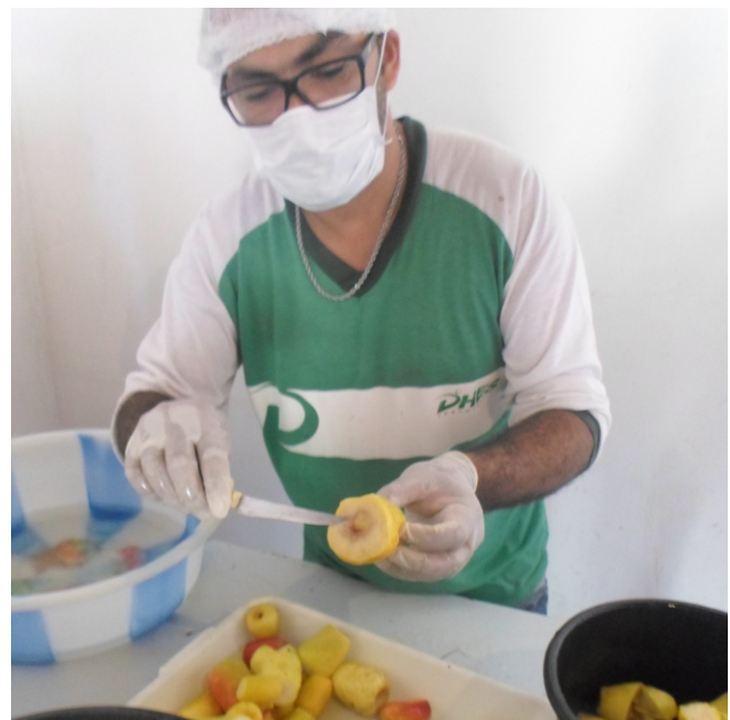
Processamento de frutos do Cerrado é mais uma atividade de capacitação promovida pelo CESTE

A atividade foi realizada no mês de setembro, na Unidade Demonstrativa de Agroextrativismo. Ao todo, 15 pessoas participaram. Além dos frutos do Cerrado, outro tema debatido foi a importância da saúde da família e os hábitos que devem ser adotados para proporcionar uma vida mais saudável. Também foi abordado o perigo que as queimadas representam para a comunidade, além dos prejuízos causados ao meio ambiente.