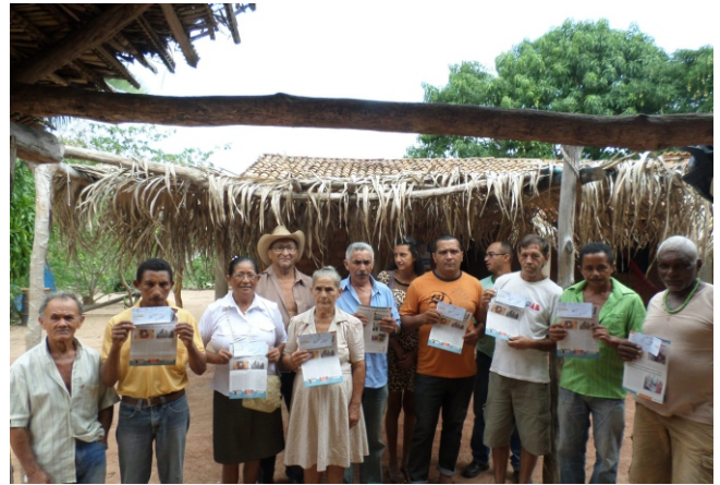
Agricultores receberam recursos para investir na produção agropecuária

O benefício faz parte das estratégias adotadas pelo Programa de Apoio à Comunidade Lindeira e à Agricultura Familiar de Subsistência, uma das iniciativas do CESTE voltadas a contribuir para a reabilitação da produção familiar de subsistência nas propriedades rurais. O repasse de recursos começou no ano passado, a pedido dos moradores. Até então, nos anos de 2010, 2011 e 2012, a empresa havia entregado kits de agricultura, contendo insumos e equipamentos. A opção de repassar o benefício em dinheiro foi decorrente do interesse do próprio agricultor e também do CESTE, que considerou uma boa oportunidade para estimular a autogestão e a autonomia das famílias, além do fato de impulsionar o comércio local.