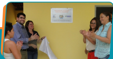
Pag. 03 - Inaugurada a Escola Dom Bosco, na cidade de Tupiratins/TO