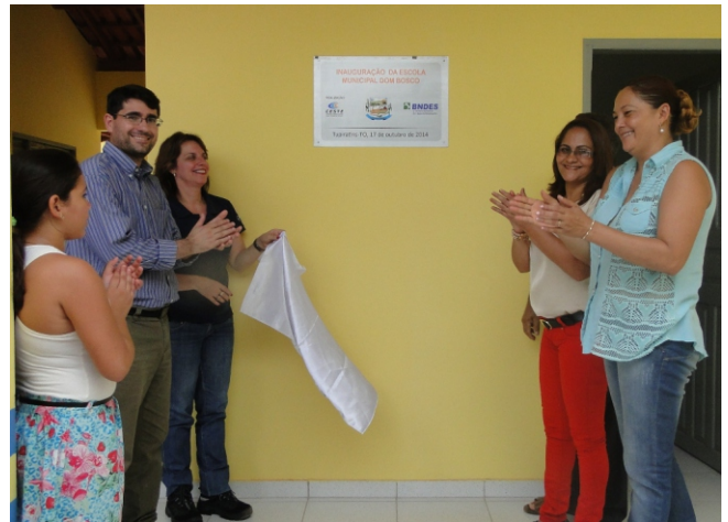
Descerramento da placa inaugural da Escola Dom Bosco: mais uma obra do CESTE na cidade de Tupiratins/TO

Os serviços na Escola Dom Bosco incluíram pintura das paredes internas, colocação de piso cerâmico e forro de PVC, reforma e pintura de janelas e portas,