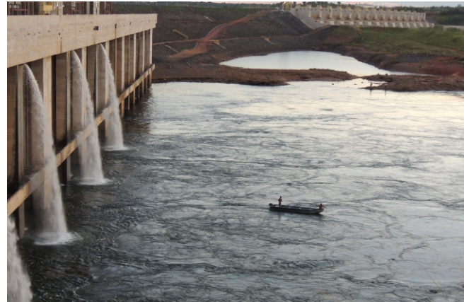
Embarcação invade à Área de Segurança da Usina Hidrelétrica Estreito, um local proibido e extremamente perigoso

Ao fortalecer a fiscalização na Área de Segurança da Usina Hidrelétrica Estreito, bem como buscar apoio