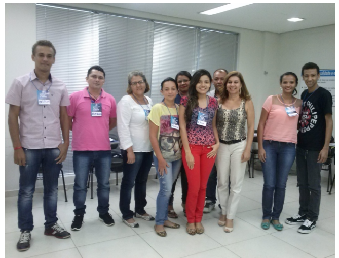
Uma das turmas de empreendedores que participou do curso “Iniciando um Pequeno Grande Negócio”

Cada turma participou de cinco dias de treinamento, totalizando dez encontros, que abordaram temas como análise de mercado, identificação de oportunidades de negócio, processos administrativos, gestão financeira, pesquisa de mercado, análise da