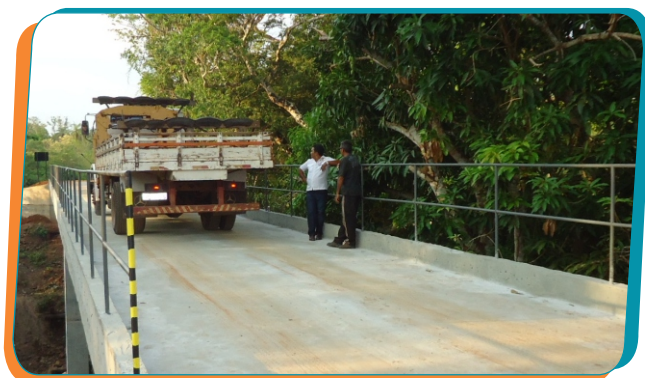
Construção da ponte sobre o rio Itaperucu, no Povoado Taboquinha era uma antiga aspiração da comunidade