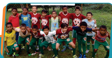
Pag. 03 - CESTE vai apoiar o projeto Bola pra Frente, em Filadélfia/TO