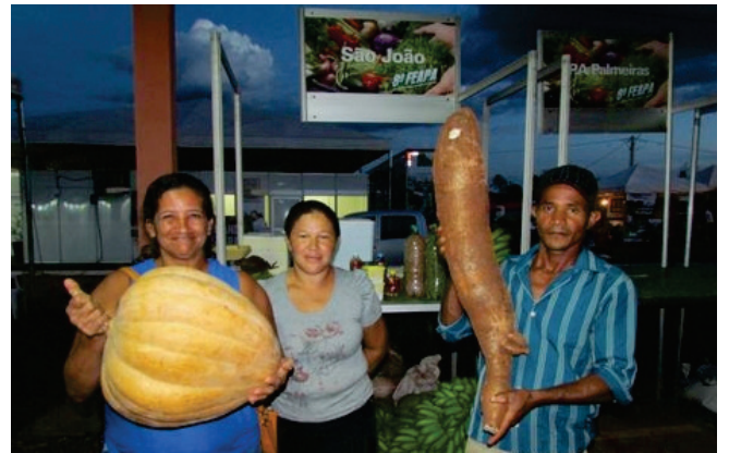
CESTE organizou a participação dos agricultores do RRC São João na VIII FEAPA, realizada na cidade de Palmeiras do Tocantins/TO

Além do apoio institucional e da orientação aos reassentados, o CESTE repassou 1.500 mudas de árvores nativas para distribuição ao público. Essas mudas são cultivadas no viveiro da empresa, localizado na área da Usina Hidrelétrica Estreito.