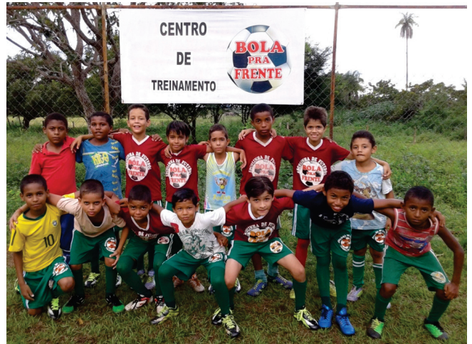
Projeto Bola pra Frente oferece escolinha de futebol para 200 crianças e adolescentes do município de Filadélfia/TO

Coordenado pela Associação Esportiva e Recreativa de Filadélfia/TO, o projeto Bola pra Frente oferece escolinha de futebol de campo para crianças e adolescentes de 7 a 17 anos de idade, a maioria de baixa renda. A meta é incentivar os alunos a praticar esporte,