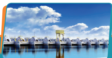
Pag. 02 - Compensação financeira supera montante de R$ 90 milhões

Inaugurados no segundo semestre de 2013, os dois projetos apresentam resultados expressivos: são 49 famílias diretamente beneficiadas, 68 apicultores capacitados, 17 toneladas de mel produzidas e comercializadas, além de oito municípios do entorno da Usina Hidrelétrica Estreito que utilizam as estruturas construídas.