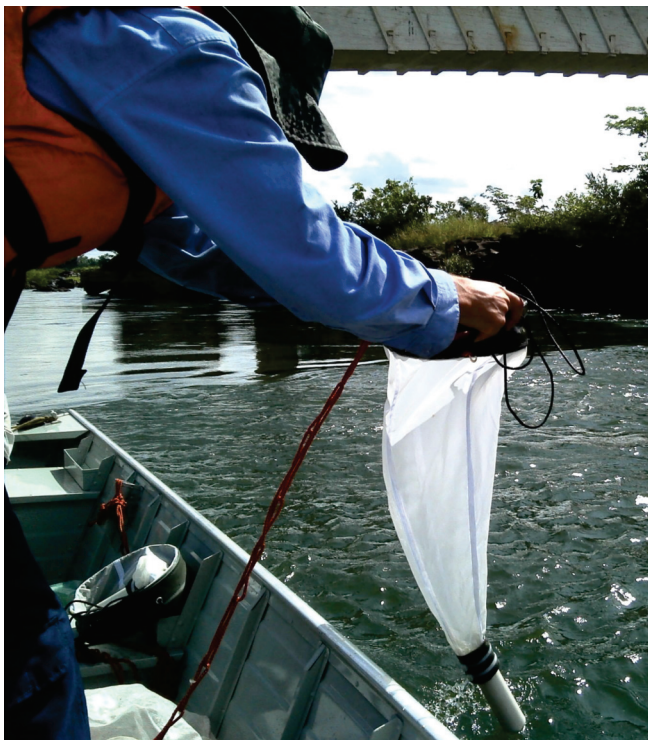
Primeiramente, as amostras são coletadas em 26 pontos de monitoramento no reservatório da Usina Hidrelétrica Estreito

O monitoramento da qualidade da água da bacia do rio Tocantins vem sendo realizado desde setembro de 2009, o que possibilitou a execução de estudos e análises antes, durante e após o enchimento do reservatório da Usina Hidrelétrica Estreito. A comparação dos dados obtidos durante esses três períodos permite uma avaliação mais detalhada e confirma a manutenção da boa qualidade da água no rio Tocantins após a construção do empreendimento.