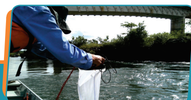
Pag. 04 - Amostras comprovam a boa qualidade da água do rio Tocantins