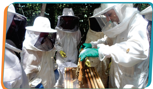
Projeto Cerrado Doce fortaleceu a apicultura na região, assegurando trabalho e renda a famílias residentes em municípios do entorno da Usina Hidrelétrica Estreito