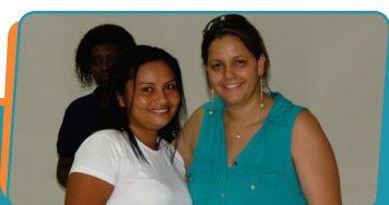
Pag. 03 - Profissionais de saúde recebem certificados do Curso de Atualização