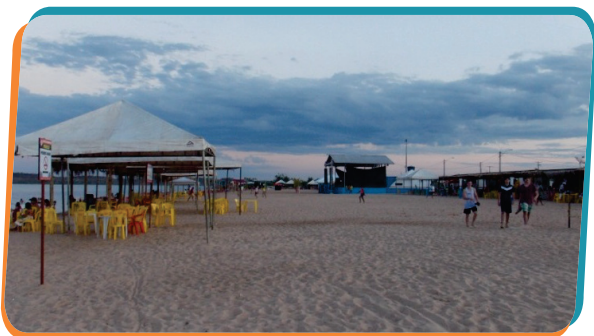
Comunidade elogiou as obras de infraestrutura construídas pelo CESTE na praia de Filadélfia/TO