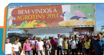
Pag. 04 - Moradores da região participam de feiras agropecuárias