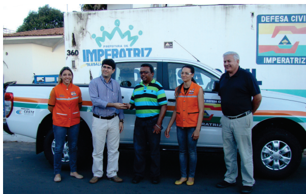
Entrega da camionete é mais um benefício proporcionado pelo CESTE à Defesa Civil de Imperatriz/MA

A entrega da camionete é mais uma ação do CESTE para beneficiar a Defesa Civil de Imperatriz/TO. No ano passado, a instituição recebeu um barco com capacidade para cinco tripulantes e motor de 60 hp para fazer atendimento a emergências provocadas pelas cheias sazonais que causam problemas na cidade. Antes disso, já haviam sido entregues estação hidrométrica/telemétrica e material de escritório,