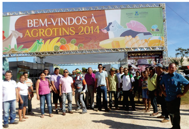
Agrotins foi uma das feiras visitadas pelos agricultores

A participação nessas feiras é uma das ações realizadas pelo CESTE, cuja meta é que a orientação