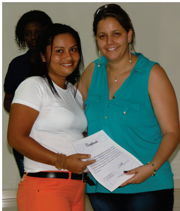
Participante recebe certificado do Curso de Atualização para Profissionais da Saúde

Promovido pelo CESTE, em parceria com as secretarias municipais de saúde, os cursos contaram com a participação de 324 profissionais, entre médicos, enfermeiros, agentes comunitários de saúde, nutricionistas, agentes de combate a endemias, coordenadores de vigilância sanitária, coordenadores de programas de saúde, técnicos de enfermagem, técnicos de laboratório, agentes sanitários, fiscal sanitário, assistentes sociais, professoras e coordenadores da administração municipal.